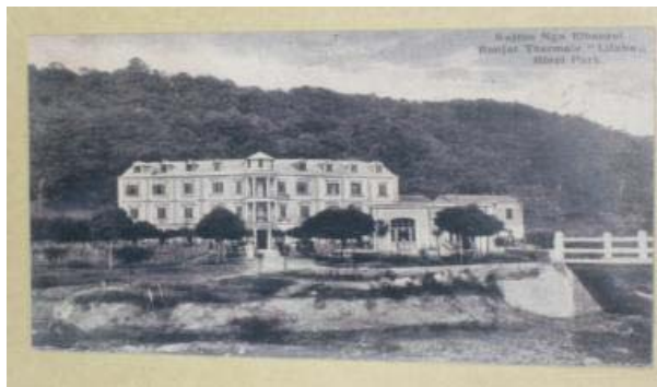
Fig.2. L'albergo "Park Nosi", terme di Elbasan

Le terme richiamarono l'attenzione dei cittadini di Elbasan. Dopo il 1930 furono costruiti i primi alberghi. Due famiglie importanti, quella dei Nosi e gli Stringa realizzarono due complessi sanitari curativi con edifici che ora sono conosciuti come le terme di Nosi ( Hotel Park costruito nel 1932 e Vila poi nel 1975). Secondo i dati del Ministero delle Finanze di quel periodo, l'investimento della famiglia Nosi per la costruzione della stazione idrotermale medica "Parco Nosi" fu stimato intorno ai 175.000 franchi d'oro. La stazione medica iniziò il suo funzionamento il 28 maggio 1932 solo dopo aver ottenuto l'autorizzazione per l'utilizzo dell'acqua termale. L'autorizzazione fu concessa durante l'assemblea generale dell'alto Consiglio di Stato con delibera n. 232 datata il 20/06/1932. La stazione idrotermale medica era immersa nel verde, munita di caffetteria e di altre strutture ricreative.