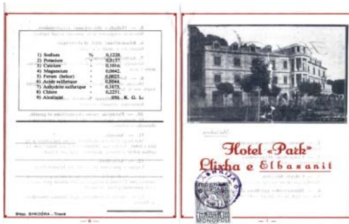
Fig.3. Volantino delle terme di Elbasan, Hotel "Park Nosi" (1932)

Con l'istituzione del sistema comunista gli spazi curativi e le stazioni idrotermali passarono allo stato 3 . Durante questo periodo gli spazi curativi e gli edifici prima costruiti avevano prevalentemente carattere ospedaliero. Furono utilizzati per scopi totalmente medici trasformandosi in importanti centri curativi. I visitatori da accogliere venivano sottoposti all'attenzione di una commissione medica facendo così assomigliare le terme sempre più ad centri ospedalieri, quadro esistente tutt'ora. Il movimento della popolazione era controllato e la capacità delle strutture curative di Elbasan era circa 380 posti letto (Bozgo, A., 1984). C'erano 3 edifici statali (Ylli 1 e 2) e gli edifici ereditati dalla famiglia Nosi. Vicino all'edificio ereditato da questa famiglia fu costruito un nuovo edificio a un piano, denominato "Vila", che servì solo a membri del partito di quell'epoca. In questo periodo, sulla base di studi più adeguati, furono rivalutati i valori curativi delle sorgenti minerali termali. A seconda della composizione furono specificate le malattie curate da ogni sorgente.