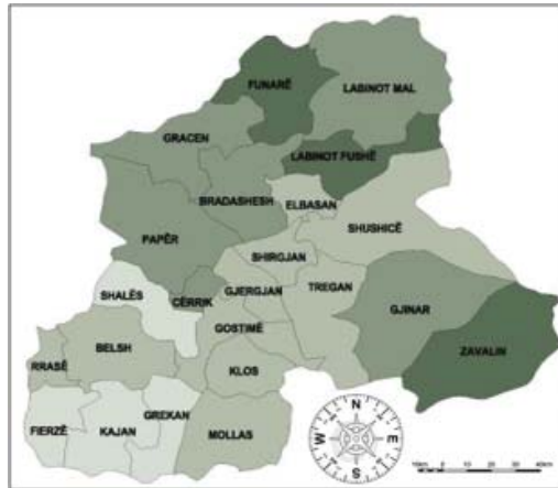
Figura 1. Mappa amministrativa di Elbasan 1

La distanza delle Llixha (terme) dalle città più importanti dell'Albania è: 155 km da Shkodra, 128 km da Lezha, 292 km da Kukës, 165 km da Dibra, 68 km da Tirana, da Durazzo 93 km, da Korca 137 km, 143 km da Berat, da Gjirokastra 218 km, 102 km da Fier e 134 chilometri da Valona (Distretto Elbasan, 2007). Con alcune delle città più importanti dei Balcani queste distanze sono: 190 km da Ulcinj, 225 km da Tetovo, 320 km da Prizren, 451 km da Pec, 254 km da Skopje, da Ohrid 139 km, 100 km da Struga, da Atene 630 km ecc.